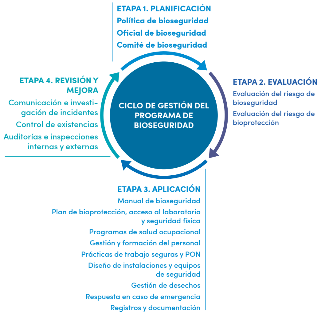
Figura 2.1 Ciclo de gestión del programa de bioseguridad